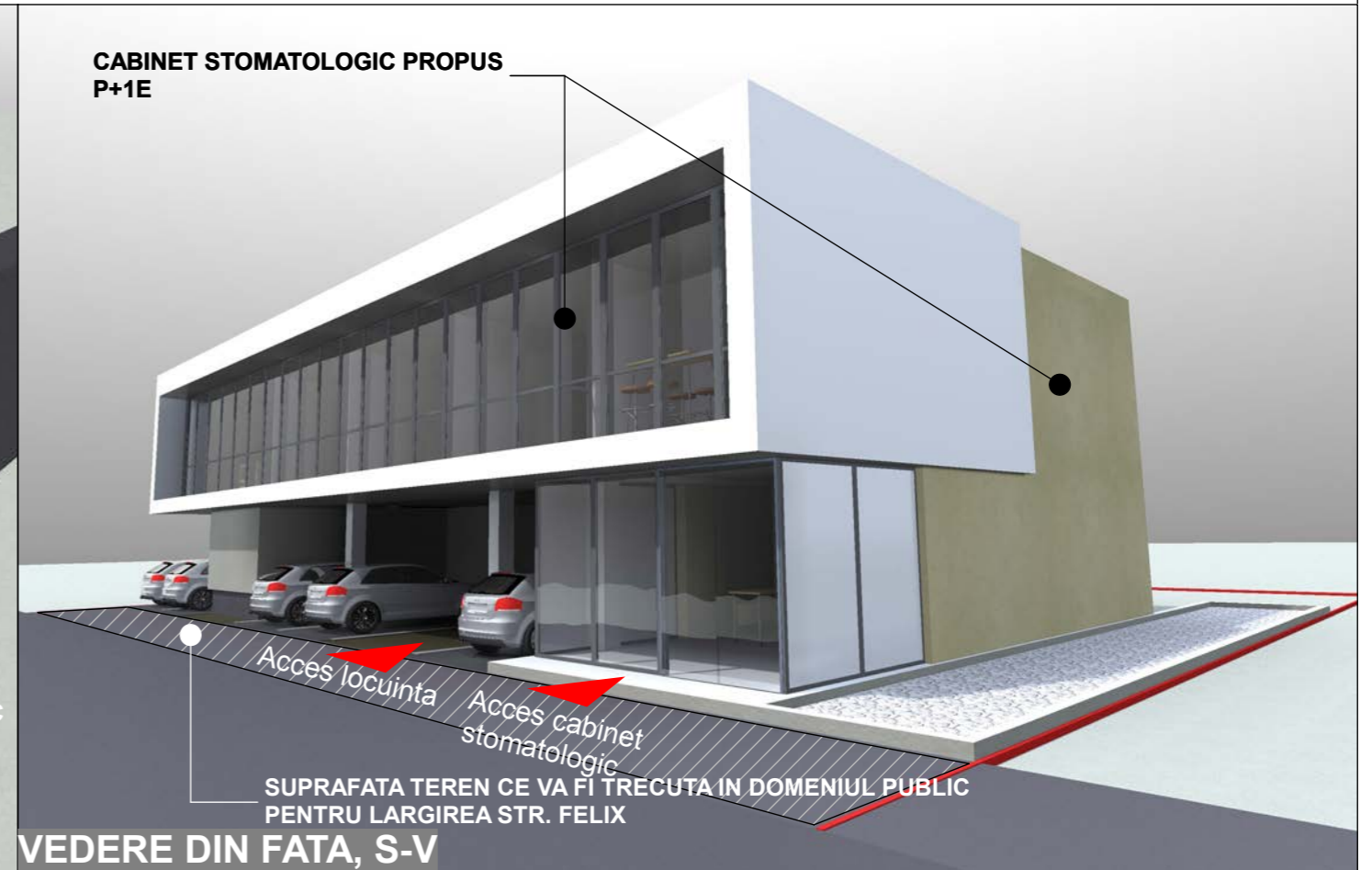
VEDERE DIN FATA, S-V